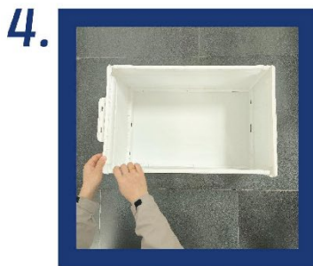
4. Richten Sie anschließend die Vordertür auf die gleiche Weise an den Schnappverschlüssen aus und befestigen Sie sie.