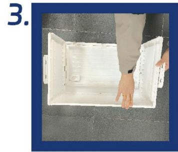
3. Drehen Sie das Produkt nach der Montage der Rollen wieder in die aufrechte Position. Öffnen Sie die Seitentür, richten Sie sie an den Schnappverschlüssen der Rückwand aus und drücken Sie sie fest, bis sie sicher befestigt ist.