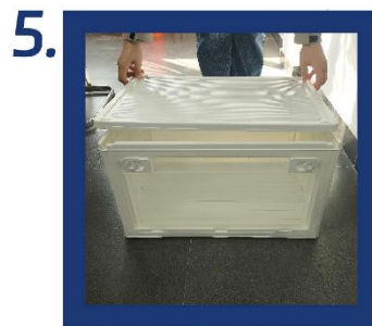
5. Setzen Sie die obere Abdeckung auf und stellen Sie sicher, dass sie gerade sitzt.