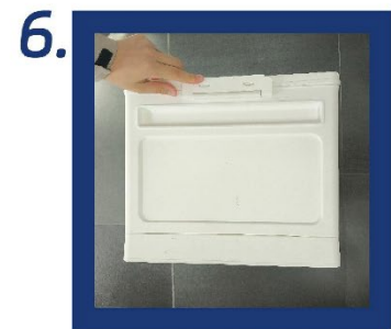
6. Befestigen Sie zum Abschluss der Montage die Griffe an beiden Seiten.